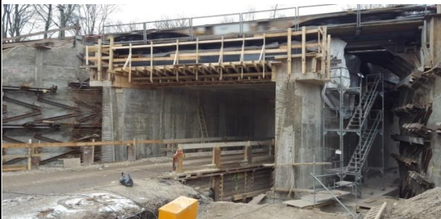
vor Anheben inkl. Hilfsbrücken