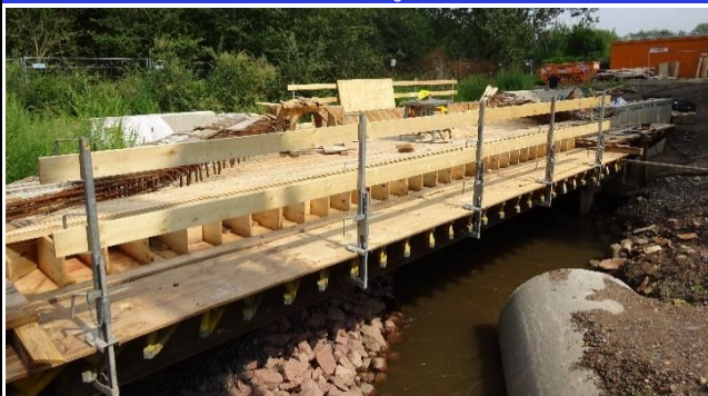
Traggerüst und Schalung Überbau