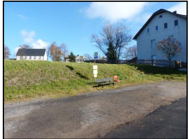
unzureichend ausgebaute Bushaltestellen