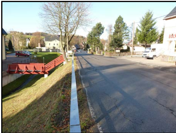
schlechter Fahrbahnzustand mit abgehender Fahrbahn