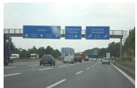
BAB 4 aus Richtung Olpe