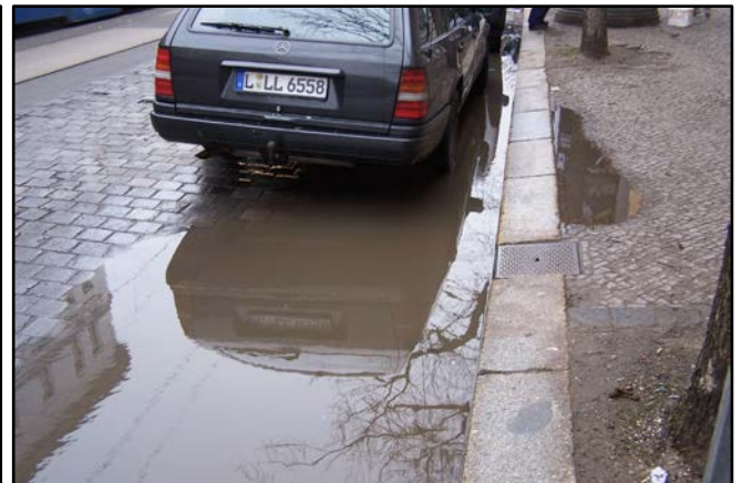
unzureichende Entwässerung von Fahrbahn und Gehweg