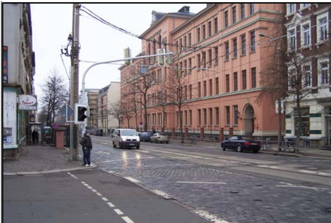
Straßenzustand vor dem Ausbau